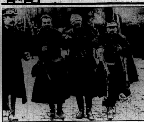
En tal día como hoy, hace veintis años, se estaba librando la gran batalla de Ypres. La fotografía muestra dos soldados belgas defendiendo el brazo a un campamento que cayó herido en la línea de combate.

Tal día como hoy, -11 de noviembre-, se registraron los sucesos históricos siguientes: