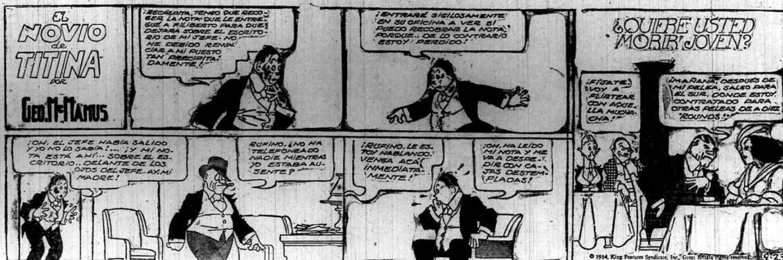
“EDUCANDO A PAPA”